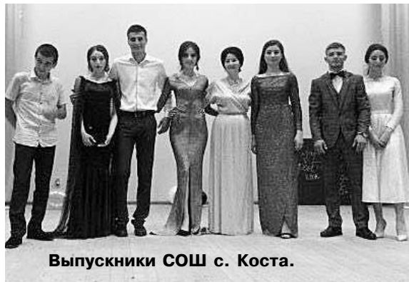
Выпускники СОШ с. Коста.